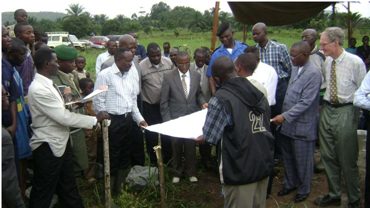
Les signatures sur le plan de masse de la construction à Beni par les invités et les officiels du CME.

Fait à Beni, le 27 novembre 2007. Par RONA KATAWANGA Joseph.