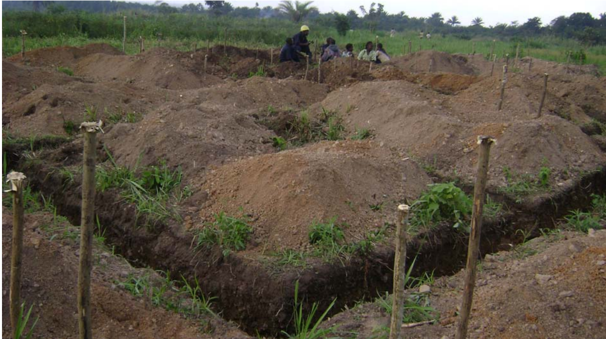
La fouille de la fondation de la Salle d'opération à Beni.